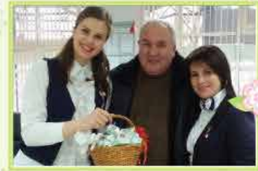
Filia nr. 12 Chișinău