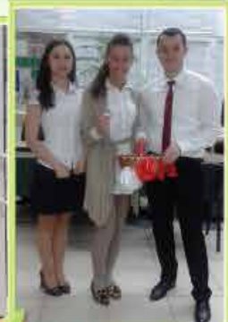
Filia nr. 9 Chișinău