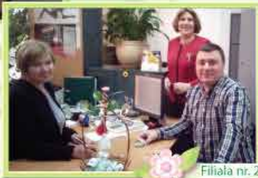
Filia nr. 2 Chișinău