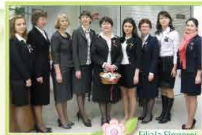
Filia nr. Singerei