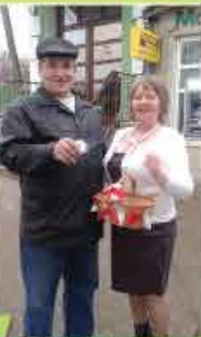
Filia nr. Șoldanești