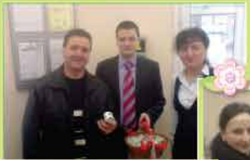
Filiala nr. 7 Chişinău