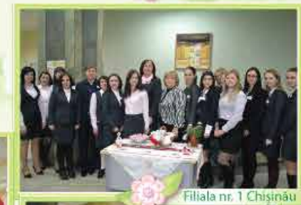
Filia nr. 1 Chișinău

În urma acțiunii prilejuite de 1 martie filialele au expediat pe adresa redacției câte un „raport foto”, astfel încât toți colegii din cadrul băncii acum au posibilitatea să urmărească cum a fost sărbătorită una dintre cele mai frumoase sărbători de cătreă întreaga echipă MAIB.