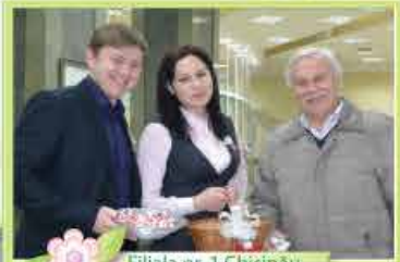
Filiala nr. 1 Chişinău