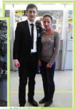
Filia nr. 4 Chișinău