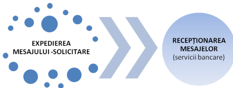
Schema 2: Procesul de utilizare a serviciului „SMS-NOTIFICĂRI”,